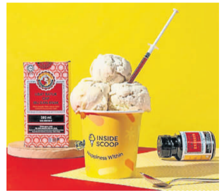
Inside Scoop 近日推出“枇杷膏冰淇淋”。

“如果已在网上订购这个口味冰淇淋，请不用担心。我们的团队将联系处理退款事宜。对于可能造成的任何不便，我们深表歉意，感谢你们的理解。”